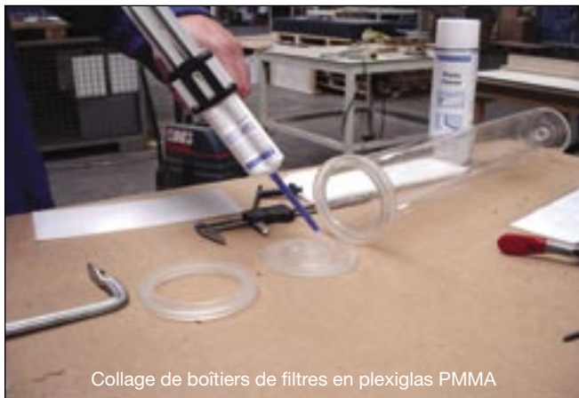
Collage de boîtiers de filtres en plexiglas PMMA

Mélangeur statique Quattro avec 20 éléments mélangeurs (sur une longueur d'env. 8 cm) pour un mélange optimal avec faibles pertes de matériau.