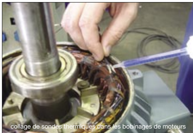
collage de sondes thermiques dans les bobinages de moteurs