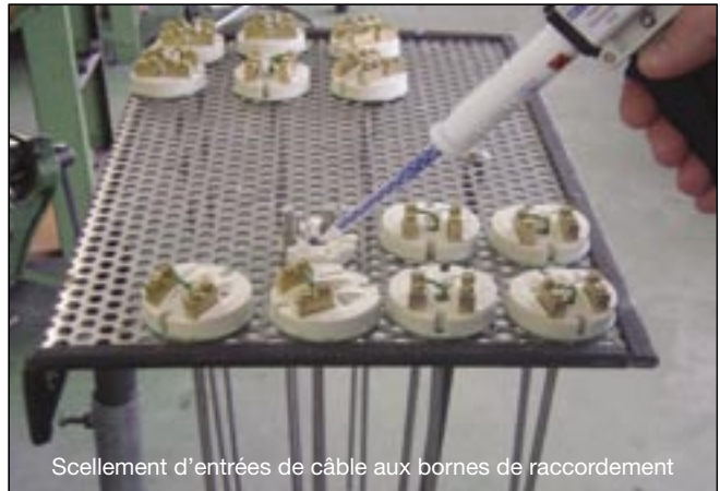
Scellement d'entrées de câble aux bornes de raccordement

L'utilisation de colles époxy WEICON offre de nombreuses possibilités d'application dans tous les domaines, depuis de simples travaux de réparation et de retouche jusqu'aux applications en série dans pratiquement tous les secteurs de l'industrie.