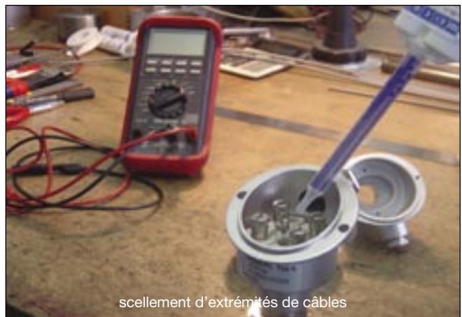
scellement d'extrémités de câbles