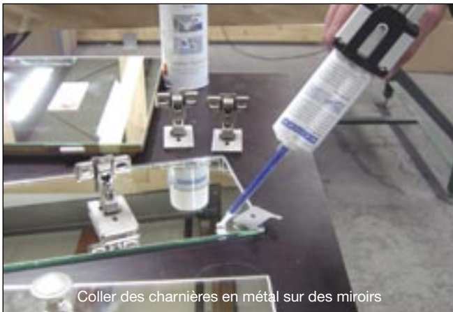
Coller des charnières en métal sur des miroirs

(p.ex. assemblages d'aspect attrayant à ténacité élevée). Des exigences supplémentaires résultent encore du fait que ces matériaux sont souvent combinés entre eux.