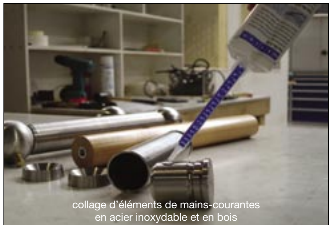
collage d'éléments de mains-courantes en acier inoxydable et en bois

Les indications et recommandations figurant dans ces prospectus ne constituent pas des propriétés garanties. Elles se basent sur les résultats de recherches et des expériences. Elles sont donc, sans engagement, énoncées dans le respect des conditions de mise en œuvre, lorsque les conditions spécifiques d'application chez l'utilisateur ne nous sont pas connues. Nous ne pouvons garantir que la constance de la haute qualité de nos produits. Nous recommandons donc à tout utilisateur de faire ses propres essais pour déterminer si le produit indiqué possède les propriétés recherchées. Il n'en découle aucune précaution pour l'utilisateur. Celui-ci porte seul la responsabilité d'une utilisation erronée ou non conforme à la destination du produit.