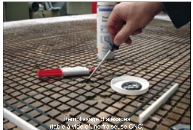
Remplissage d'alésages (table à vide d'une fraiseuse CNC)

Les colles minute WEICON époxy et WEICON Fast-Metal conviennent spécialement pour des travaux occasionnels de réparation et d'entretien. L'application se fait à l'aide de la double seringue pratique. La résine et le durcisseur sont ainsi dosés automatiquement dans la proportion correcte. La procédure de mélange se fait ensuite manuellement.