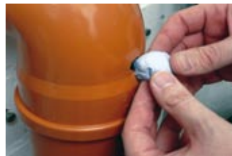
Reparaciones de desagües PVC