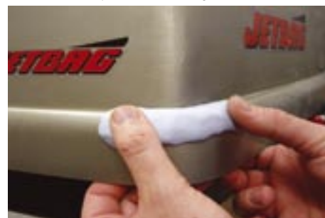
Reparaciones de remolques/porta equipajes