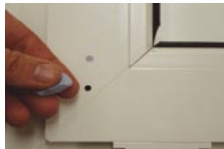
Relleno de agujeros en marcos de PVC