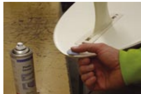
Reparaciones de tablas de surf